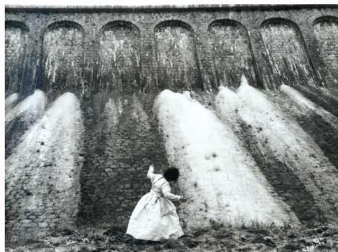
Autoportrait en robe de prêtre , 1986.

Ces sculptures bien qu'abstraites renvoient à la statuaire classique des bustes, avec les rapports de proportion entre le socle en bois et la pierre taillée. L'obsidienne, cette pierre noire qu'affectionne particulièrement Jean-Michel Othoniel, fonctionne ici comme un miroir restituant notre reflet distordu, livré à notre imaginaire. À la fois ombre et lumière, ses sculptures nous mettent face à nous-mêmes, à notre inconscient. Elles renvoient entre autres aux miroirs en obsidienne utilisés dans plusieurs cultures anciennes, qui étaient considérés comme une porte entre le monde réel et le royaume des esprits.