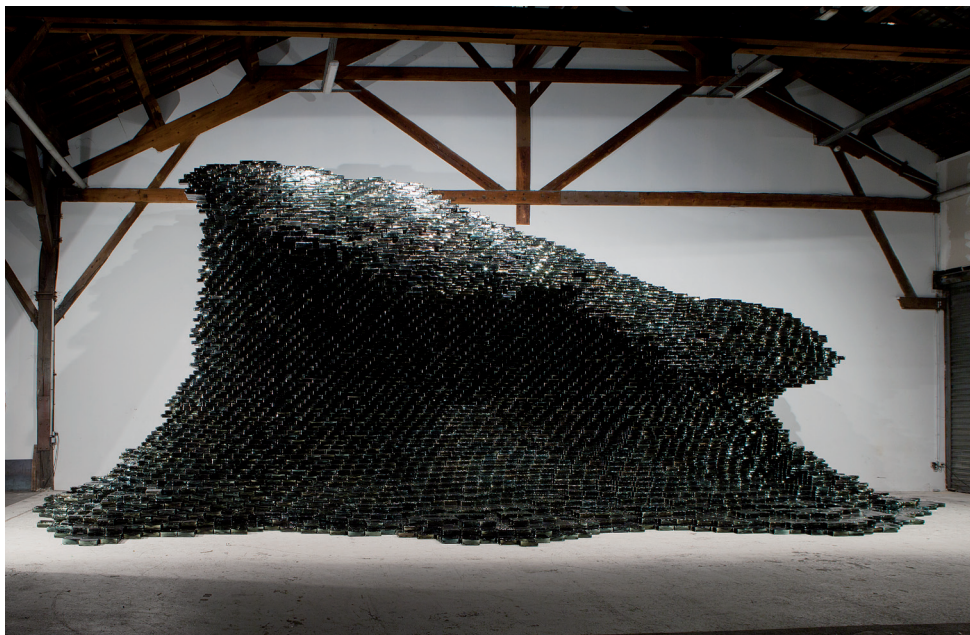
The Big Wave , 2018. Verre indien, métal. Vue de l'œuvre dans l'atelier parisien de l'artiste.

5.50 x 15 x 5 m.