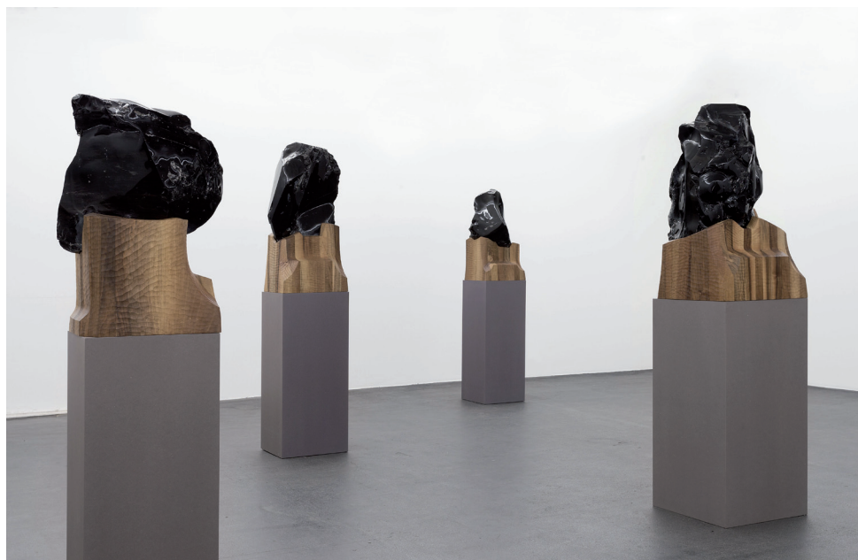
Invisibility Face , 2015. Obsidienne, socle en bois de marronnier. 105 x 55 x 60 cm.