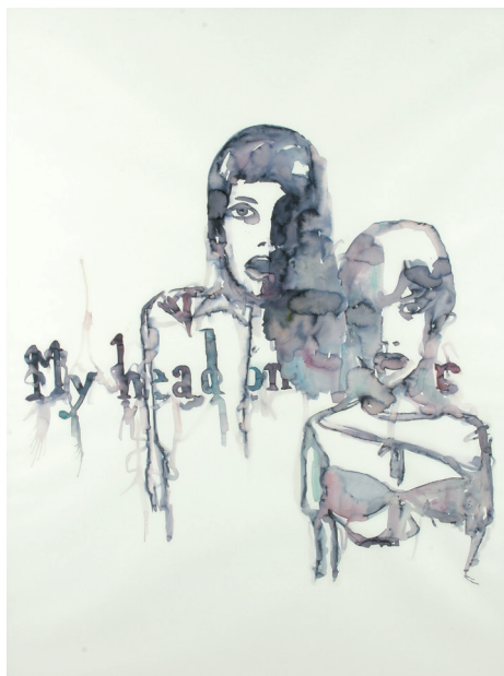
Rebecca Bournigault, My head on the door , 2007. Aquarelle vernie sur papier, 142 x 106,5 cm.

Le papier détermine un espace de l'œuvre qui lui est propre. Et c'est depuis cet espace formel que les images nous interpellent et qu'elles questionnent, de façon parfois inquiétante, l'espace du réel où évolue le spectateur.