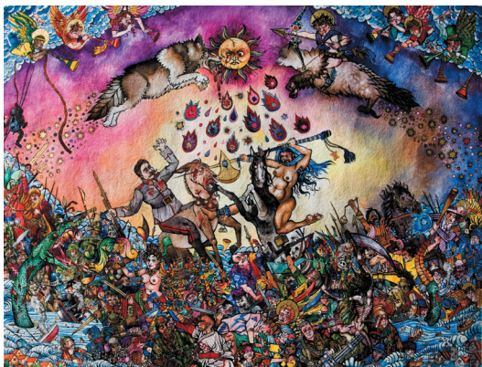
Agathe Pitié, Apocalypse , 2011. Encres de Chine pigmentées, aquarelles et dorure liquide sur papier à la cuve, 100 x 140 cm. Collection Benjamin Nay.

Née à Castres en 1986, elle est diplômée de l'École Nationale Supérieure des Beaux-Arts de Paris.