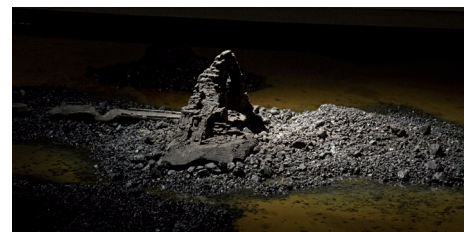
Construction IV de l'ensemble : Domus Aurea, 1975-1978. Eau, bois, charbon de bois, 18 m x 5 m. Collection FRAC Bretagne, Rennes.