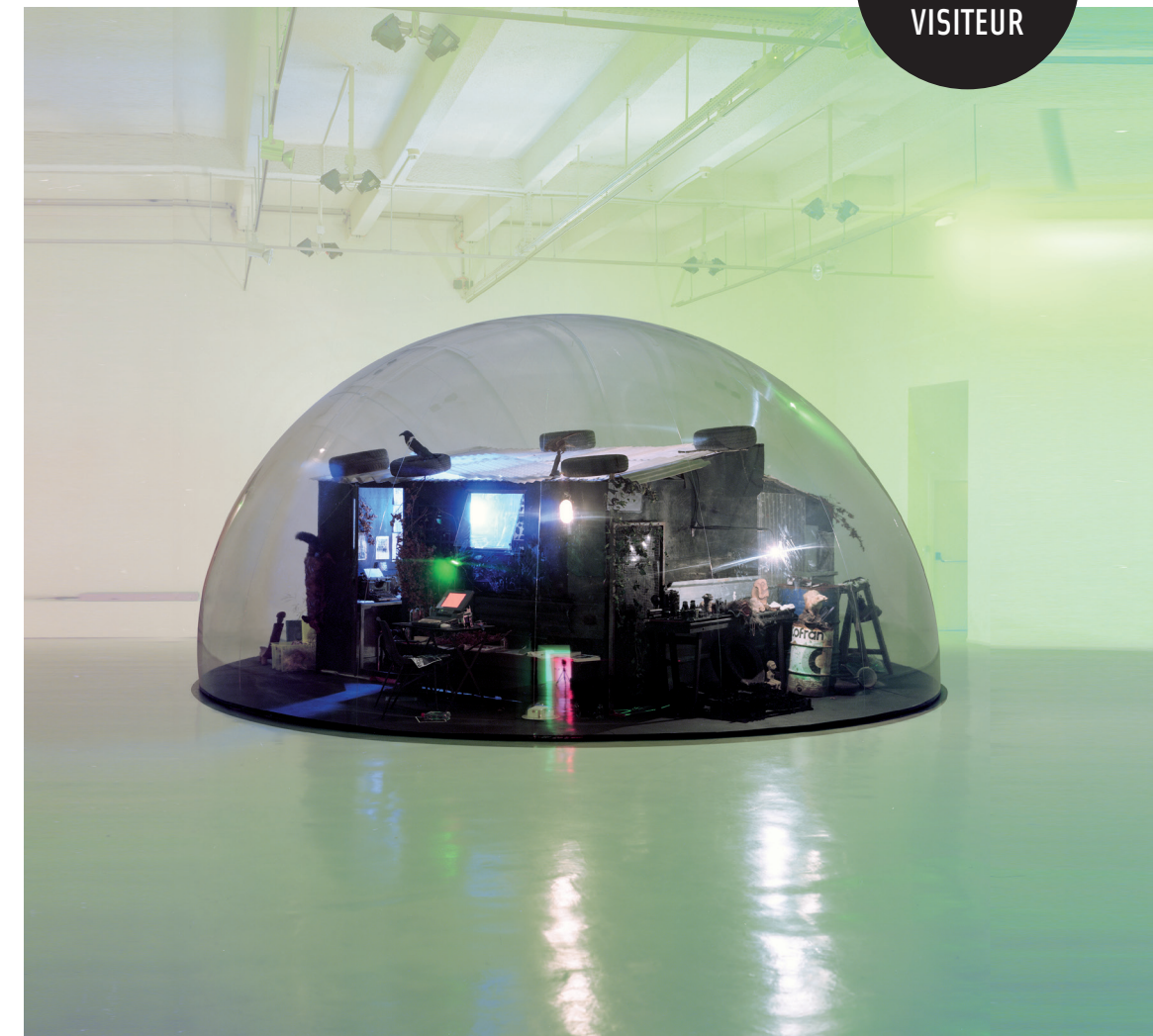
Danger zone , 2011. Techniques mixtes, hauteur : 350 cm (hauteur) x 700 cm (diamètre). Collection Claudine et Jean-Marc Salomon. Photo : Anne et Patrick Poirier. © ADAGP, Paris 2016.