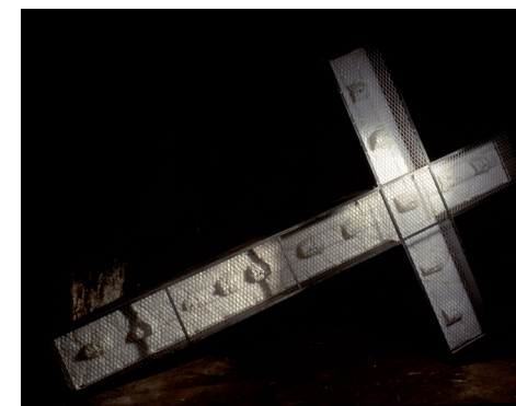
Dépôt de mémoire et d'oubli , 1989. Empreintes papier Japon, croix en fer et feuilles d'aluminium, 410 x 280 cm. Collection Anne et Patrick Poirier.

Conscients de la vulnérabilité des choses, les artistes travaillent à en préserver la mémoire : « nous nous sommes aperçus d'une manière pragmatique et expérimentale que la mémoire est une chose infiniment précieuse au niveau culturel et personnel. » 6