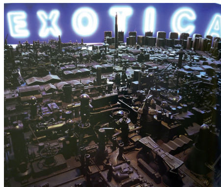
Exotica (vue d'ensemble), 2000. Peinture, bois, carton, plastique, verre, néon, 1500 x 1100 x 80 cm. Collection Claudine et Jean-Marc Salomon. © Anne et Patrick Poirier / ADAGP, Paris 2016.

Après leurs études à l'École Nationale Supérieure des Arts Décoratifs de Paris, le couple est pensionnaire de la Villa Médicis à Rome de 1967 à 1971. La ville de Rome joue d'ailleurs un rôle fondateur dans leur travail, ils y ont consacré plusieurs années d'études. Depuis, Anne et Patrick Poirier ne cessent de prendre la route, d'arpenter des sites archéologiques ou de parcourir des villes : du temple d'Angkor Vat (Cambodge) à La Havane (Cuba), de Los Angeles (États-Unis) à Berlin (Allemagne), ils rapportent des notes, des plans et des photographies. À partir de cette matière, ils créent des œuvres fictionnelles aux multiples facettes (maquettes, sculptures, photographies, installations). Leurs thèmes principaux tournent autour de la réflexion sur la mémoire, la fragilité des civilisations, la construction et la destruction des villes, la ruine, les reliquats du passé, les désastres de l'Histoire, etc. Leurs œuvres font appel à diverses métaphores visuelles et spatiales, dont l'une d'entre elles, Daïdalopolis , est une installation réalisée en 2016 spécialement pour cette exposition.