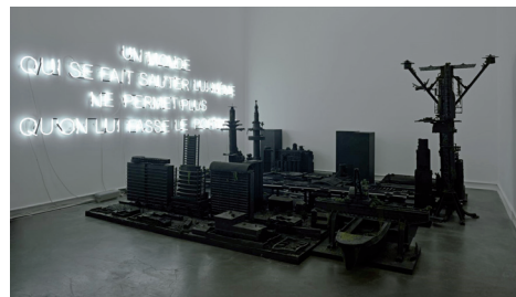
2235 après J.-C. , 2001. Techniques mixtes, dimensions variables. Collection Anne et Patrick Poirier. Courtesy Galerie Mitterrand. Photo : Rebecca Fanuele. © Anne et Patrick Poirier / ADAGP, Paris 2016.

Ces installations, si elles sont elles-mêmes figées dans le temps, rendent aussi bien compte des destructions de l'histoire ou d'événements catastrophiques que de constructions à venir, vouées elles-mêmes inéluctablement à disparaître.