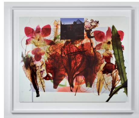
Archives , 2013. Photographie contrecollée sur dibon et encadrée, 150 x 195 cm. © Anne et Patrick Poirier, courtesy Galerie Mitterrand.